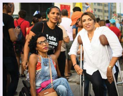
LEI CONCURSO PESSOA COM DEFICIÊNCIA