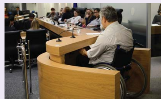
LEI TERMINAIS PESSOA COM DEFICIÊNCIA