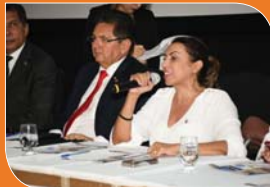
Sessão Especial sobre cortes nas universidades