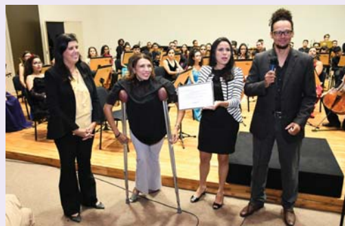
LEI ORQUESTRA SINFÔNICA DA PARAÍBA