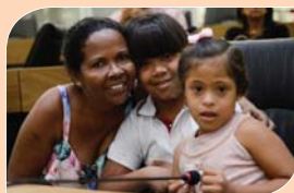
Dia Internacional da Síndrome de Down