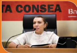
Sessão Especial sobre a extinção do CONSEA

● Discutiu a Proposta de Emenda Constitucional do governo Bolsonaro, que acaba com um dos mais importantes instrumentos de fiscalização profissional.