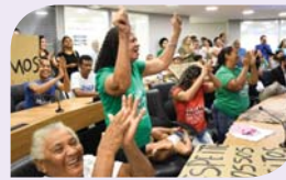
Tratando do processo de desocupação da comunidade Porto do Capim.